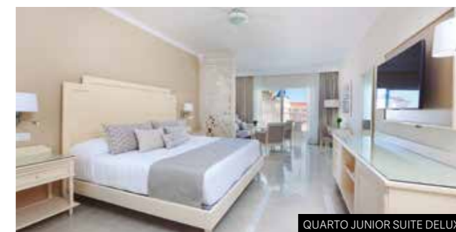
QUARTO JUNIOR SUITE DELUXE